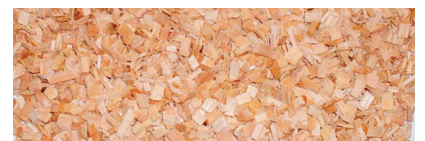
Räucherspäne Nr. 3 (2-16) Hauptkornbereich: 4,0 - 10,0 mm

Weitere Körnungen finden Sie unter www.thomsen-kg.de