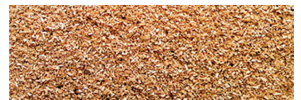
Räucherspäne Nr. HBK 750-2000 Hauptkornbereich: 0,75 - 2,0 mm