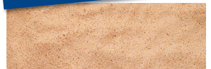
Räucherspäne Nr. HBK 500-1000 Hauptkornbereich: 0,4 - 1,0 mm

DIE RICHTIGEN KÖRNUNGEN für alle gängigen Räucherzeuger!